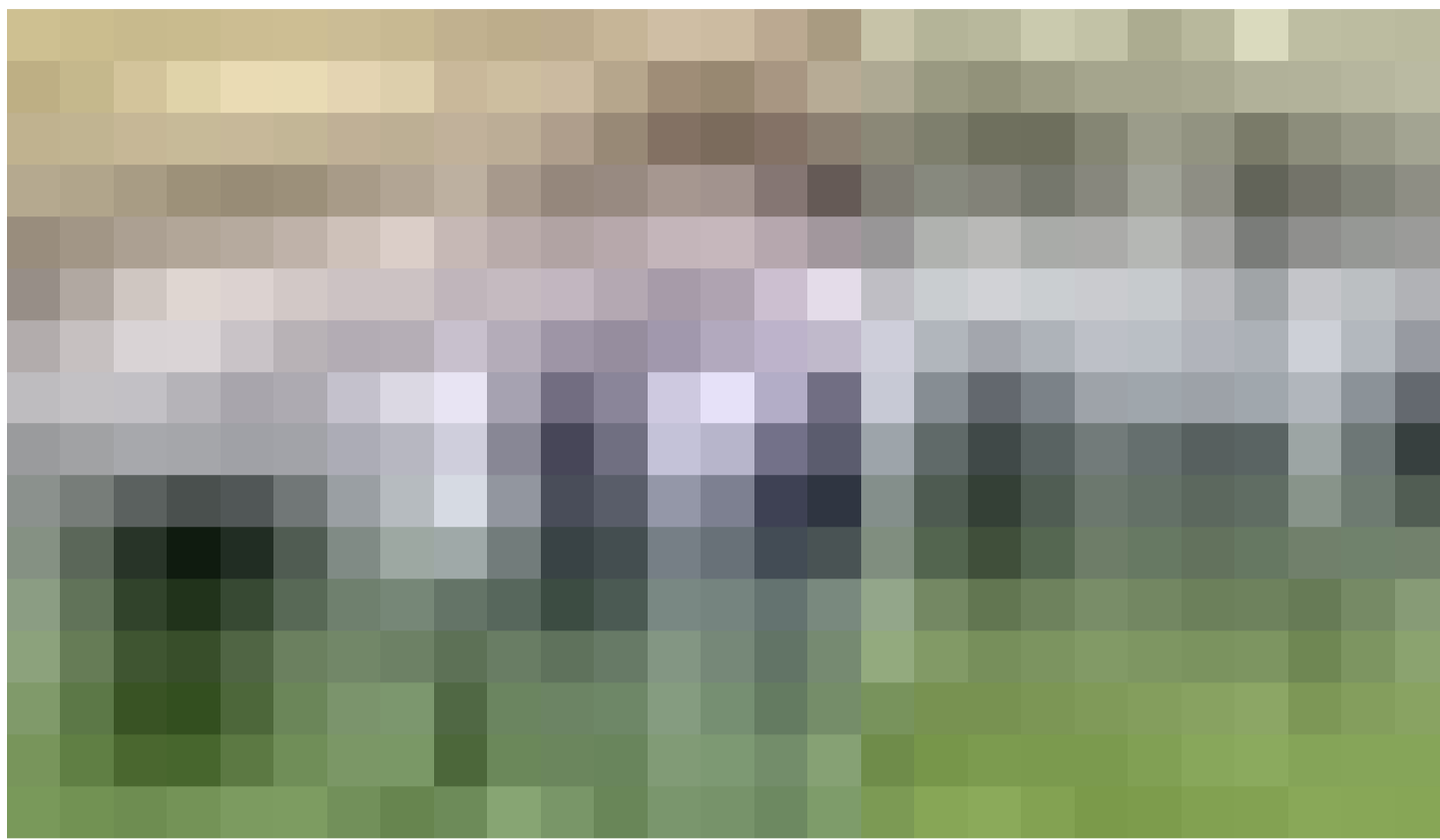
Treffen auf dem Hof des Chefs: Das Team von TAB Different wächst mit seinen Aufgaben – und das nicht nur in Ostfildern.

2019 hat sich für TAB Different dann eine weitere Möglichkeit aufgetan oder, vielleicht präziser, wurde eine neue Chance ergriffen. Im österreichischen Graz, in der Nachbarschaft zum Magna-Werk, wo die G-Klasse gebaut wird, richtete der schwäbische Automobilhersteller ein Experience-Center ein und stattete das Gelände mit allem aus, was das